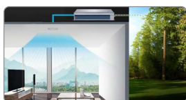
Voorzien van verse buitenluchtaansluiting