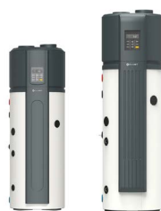
Met zonnepiraal (190S/300S)