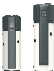
Zonder zonnepiraal (190/300)